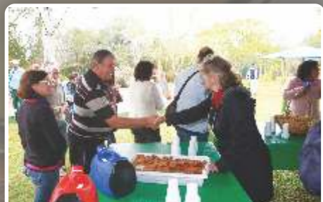
Bem cedo um delicioso café da manhã com alimentos trazidos para a partilha.