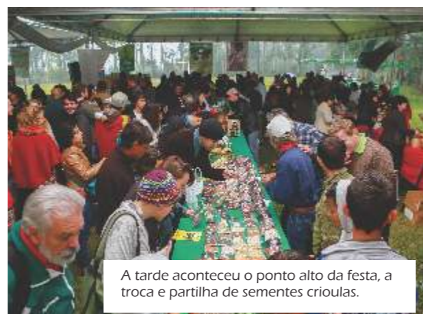
A tarde aconteceu o ponto alto da festa, a troca e partilha de sementes crioulas.