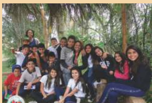
A ABAI deseja a todos os educadores muita paz, saúde e alegria nesta tão difícil e doce missão chamada Educação!