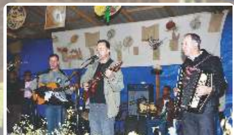
A Banda da Abai deu as boas vindas a todos e animou a festa com muita música e dança!