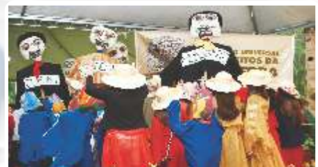
A Mística da semente teve dois momentos de oração e reflexão e apresentações de dança e teatro com crianças, adolescentes, residentes e funcionários da ABAI.