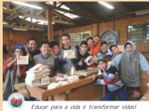
Educar para a vida é transformar vidas!