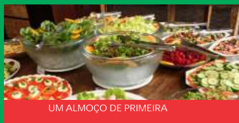
UM ALMOÇO DE PRIMEIRA

BR 116, km 141, Rua Santos Quirino, 63 - Vila Mandirituba - Fone: 3626-1892 - marianne@fvda.org.br