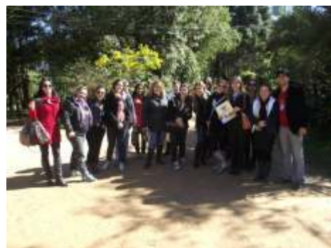
Visita do Curso de Pedagogia da Faculdade Bagozzi Conhecendo o trabalho da pedagogia social