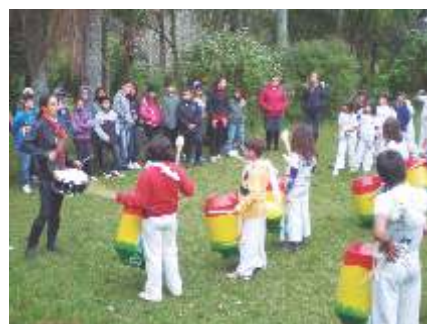
Visita do Programa ProAção do Grupo Marista (Fazenda Rio Grande) Partilhando olhares e fortalecendo vínculos

«Para nós é uma honra ter realizado o Projeto de Otimização da Biblioteca Mãe Terra. Visto que foi muito gratificante e enriquecedor, um verdadeiro aprendizado, fazendo a diferença não só aos educandos, mas a todos os envolvidos que contribuíram para a realização deste projeto.