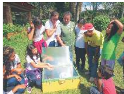
Visita da Escola Suíça na ABAI Experiências de Educação Ambiental