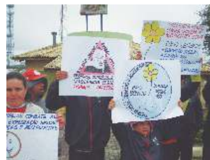
Dia Nacional do Combate ao Abuso e Exploração Sexual Educação para a participação social